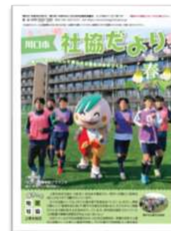
ご協力いただいた市社協 (一例です)

事務局では、今後も積極的に事業周知を行ってまいります。推進協会員の皆様にも継続して広報活動へご協力いただけますよう、お願いいたします。